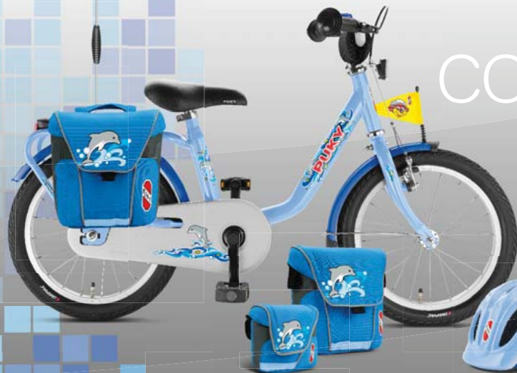
Accessoires assortis à tous les véhicules des séries «Ocean Blue», «Football» et «Capt'n Sharky»