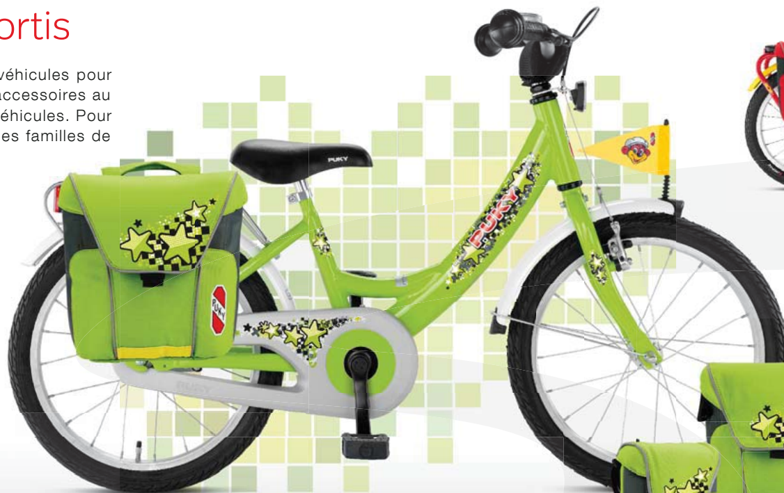
Accessoires assortis à tous les véhicules de la série «PUKY® Color»

PUKY® est le premier fabricant de véhicules pour enfants qui propose un système d'accessoires au design et à la couleur assortis aux véhicules. Pour une harmonie parfaite dans toutes les familles de produits.