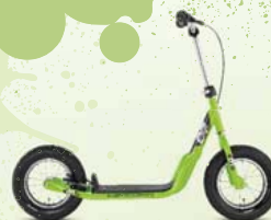
Modèle R 07L