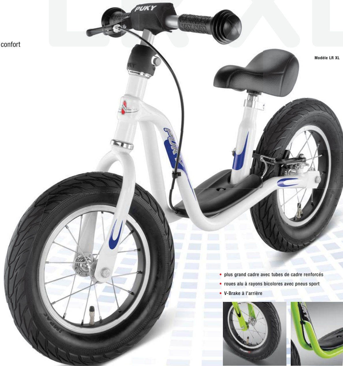
Modèle LR XL