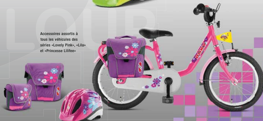
Accessoires assortis à tous les véhicules des séries «Lovely Pink», «Lila» et «Princesse Lilifee»