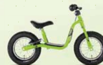
Modèle LR XL