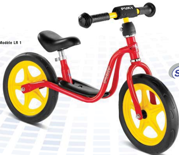
Modèle LR 1